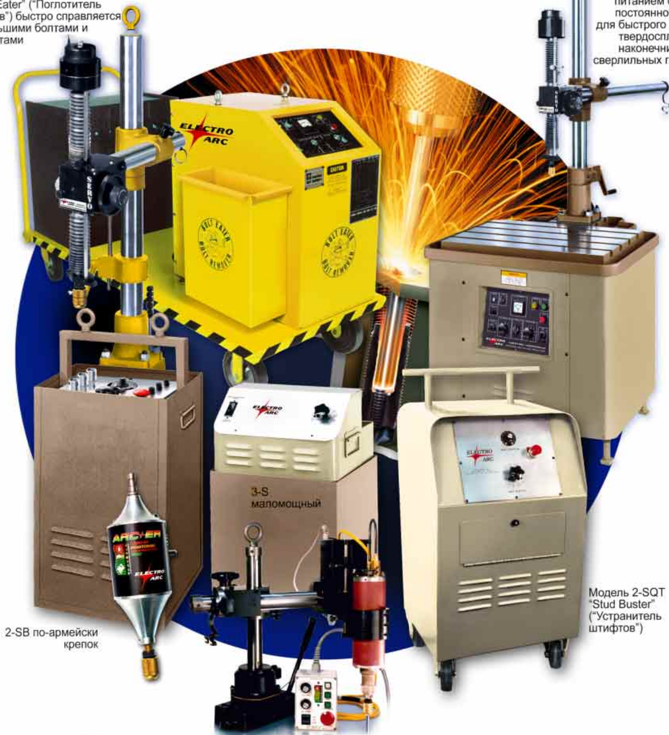
2-SB по-армейски крепко

модель 2-SAC с питанием от сети постоянного тока для быстрого снятия твердосплавных наконечников со сверлильных головок